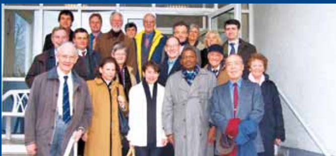
Mitglieder des Internationalen Kälteinstituts zu Besuch an der Hochschule KA und bei der TWK GmbH